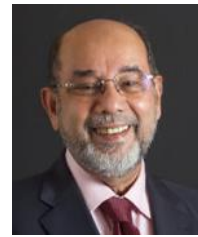
サイド・ハミド・アルバ 元マレーシア陸上公共交通委員会 議長 (IHRA 上席顧問委員)