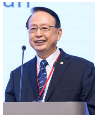
江耀宗 台湾高鐵 董事長 (台湾)