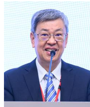
来賓挨拶: 陳建仁 第14代 台湾 副総統 (台湾)