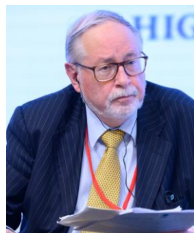
ロ德里ック・スミス インペリアル・カレッジ・ロンドン 名誉教授（イギリス）