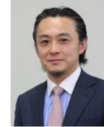
高羽陽 日本台湾交流協会 台北事務所 副代表