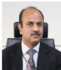
アチャル・カレー 元インド高速鉄道公社 総裁