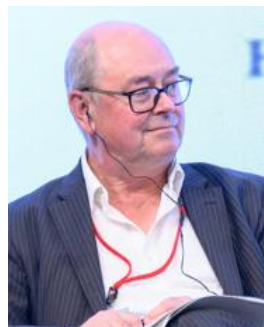
アンソン・ジャック バーミンガム大学 名誉教授 (イギリス)