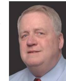
ロバート・ロウビー RCL レールセーフティコンサル ティング社 社長 元米国連邦鉄道局 副局長 / 最高執行責任者 (安全担当) (IHRA 技術検討委員)