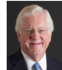
トム・シーファー 元駐日アメリカ大使 (IHRA 上席顧問委員)