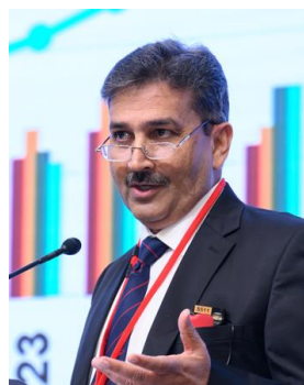
アンジャム・ペルベス インド高速鉄道公社 ディレクター（インド）