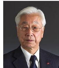
石原進 JR九州 特別顧問 (IHRA 上席顧問委員)