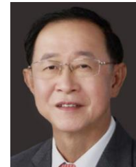
アーコム・トウムピットヤーパイシット 元財務大臣・元運輸大臣 (IHRA 上席顧問委員)