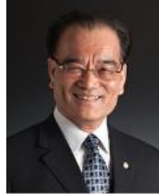
鄭光遠 台灣高鐵 總經理 (社長) (IHRA 技術検討委員)