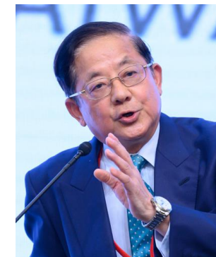
柘植康英 JR東海 取締役相談役 （日本）