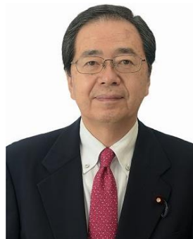
斉藤鉄夫 国土交通大臣（日本）