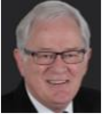
アンドリュー・ロブ 元貿易投資大臣 (IHRA 上席顧問委員)