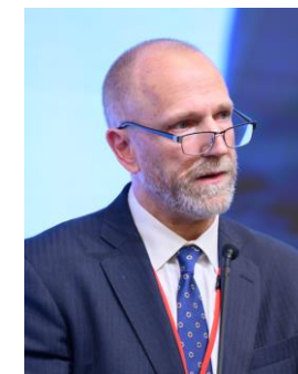
カール・アレクシー 米国連邦鉄道局 副局長 / 最高執行責任者（安全担当） （アメリカ）