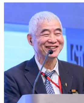
賀陳旦 元台湾交通部長（台湾）