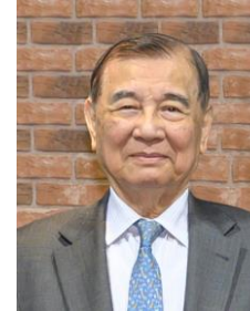
黃茂雄 台灣高鐵 董事