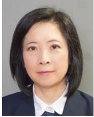
田中由紀 国土交通省 国際統括官