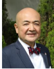
片山和之 日本台湾交流協会 台北事務所 代表