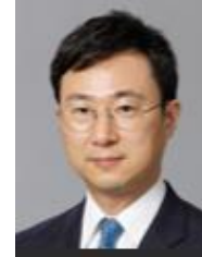
服部崇 日本台湾交流協会 台北事務所 副代表