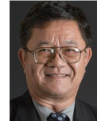
ナコーン・チャントソーン 元タイ国立科学技術開発庁 顧問 (IHRA 技術検討委員)