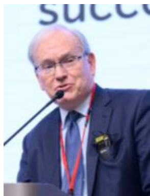
トーケル・パターソン 元IHRA 理事長代理 (アメリカ)