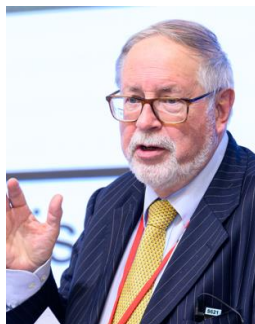
ロ德里ック・スミス インペリアル・カレッジ・ロンドン 名誉教授（イギリス）