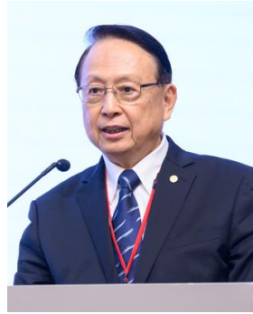
江耀宗 台湾高鐵 董事長（台湾）